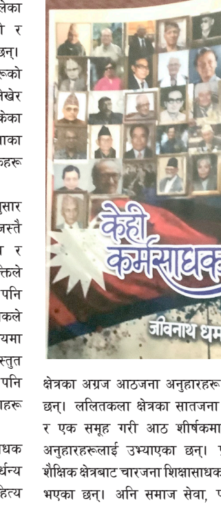
क्षेत्रका अग्रज आठजना अनुहारहरू सजिएका छन्। ललितकला क्षेत्रका सातजना कलाकार र एक समूह गरी आठ शीर्षकमा विभिन्न अनुहारहरूलाई उभ्याएका छन्। प्राज्ञिक र शैक्षिक क्षेत्रबाट चारजना शिक्षासाधकहरू चयन भएका छन्। अनि समाज सेवा, पत्रकारिता

कुनै पनि वस्तुलाई हेर्दा हेरिने ठाउँअनुसार अलग-अलग दृश्य देखिन्छ। दृश्यजस्तै व्यक्तिलाई हेर्ने दृष्टिकोण पनि समय र सन्दर्भअनुसार बेग्लाबेग्लै हुन्छ। एउटै व्यक्तिले एउटै व्यक्तिलाई हेर्ने र चिन्ने दृष्टिकोण पनि समय र सन्दर्भले फरक हुन सक्छ। लेखकले एउटै कर्मसाधकका बारेमा भिन्न-भिन्न समयमा लेखेका कुराहरूलाई भिन्नता देखाएर नै प्रस्तुत गरेका छन्। शीर्षकमा दोहोरोपना देखिए पनि खुराकामा पोषिका विश्लेषण र दृष्टिकोणहरू मात्र बनाएका छैनन्, त्यसभित्र जीवन्तता र यस पुस्तकभित्र समेटिएका कर्मसाधक व्यक्तित्वभित्र राजनीतिक क्षेत्रका ६ जना मुख्य व्यक्तिको समावेश भएका छन्। साहित्य